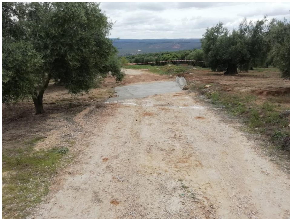
CAMINO 1.3. TAZAPLATA, PK 3,3