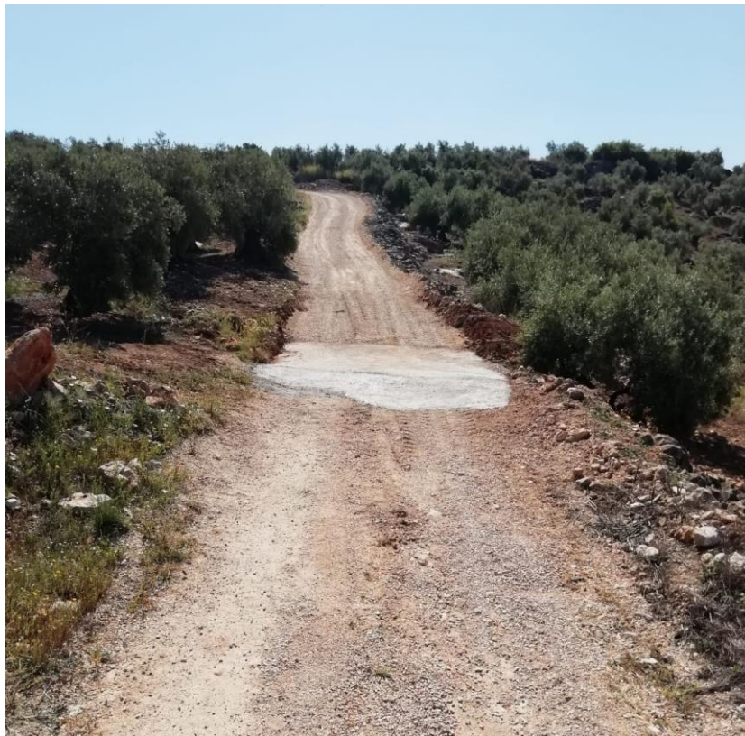
CAMINO 1.3. TAZAPLATA, PK 3,5