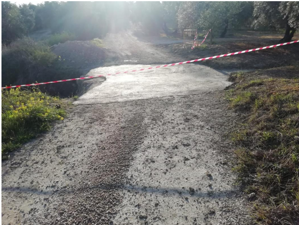
CAMINO 1.5. DE MANCIBERA. PK 2